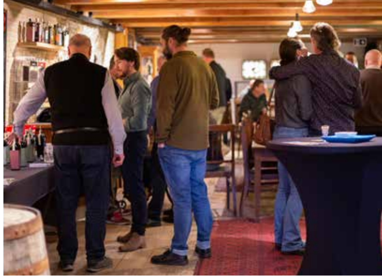
In 2019 vond wederom een succesvol Stokersfestival plaats.

Hoogtepunt van de dag was de lancering van 'Duivelsgeluk', de speciale variant van de